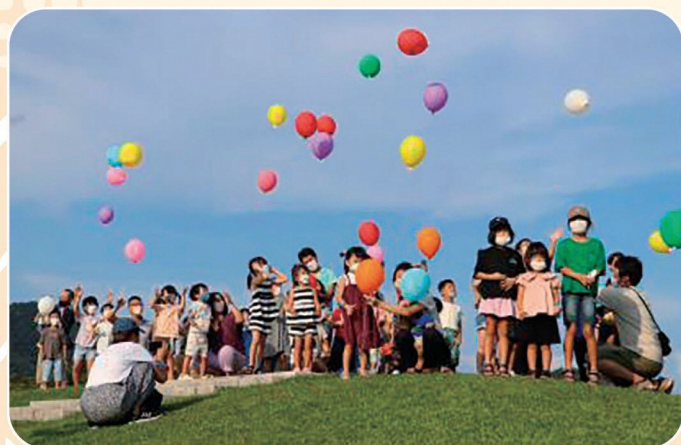
まつり フィナーレ