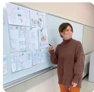
まりげの子育て交流会