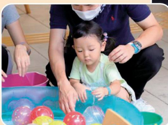
まつり ヨーヨーつり