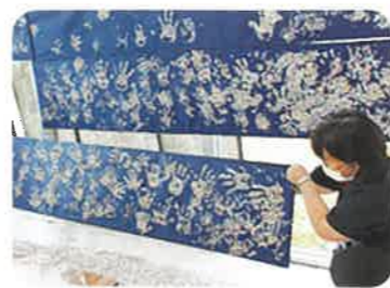
あつまっ手・つながっ手