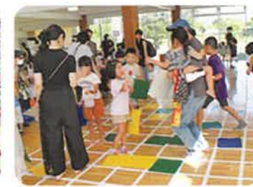
ますますジャンケン