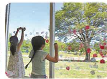
つながるスタンプ