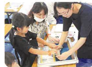
シルクスクリーン