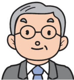
主任ケアマネジャー