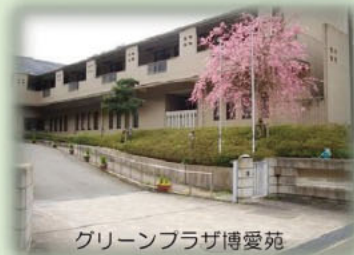
グリーンプラザ博愛苑

特別養護老人ホーム グリーンプラザ博愛苑 ☎ 65-3700 ケアハウス(特定施設入居者生活介護)グリーンプラザ博愛 ☎ 65-3702 デイサービスセンター グリーンプラザ博愛 ☎ 65-3706 ヘルパーステーション グリーンプラザ博愛 ☎ 65-3710 在宅介護支援センター グリーンプラザ博愛 ☎ 65-3705 住所: 舞鶴市字市場 390 番地 FAX: 63-1250