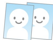
写真2枚持参下さい。 (ヨコ2cm×タテ2.5cm) 本人確認できるもの。