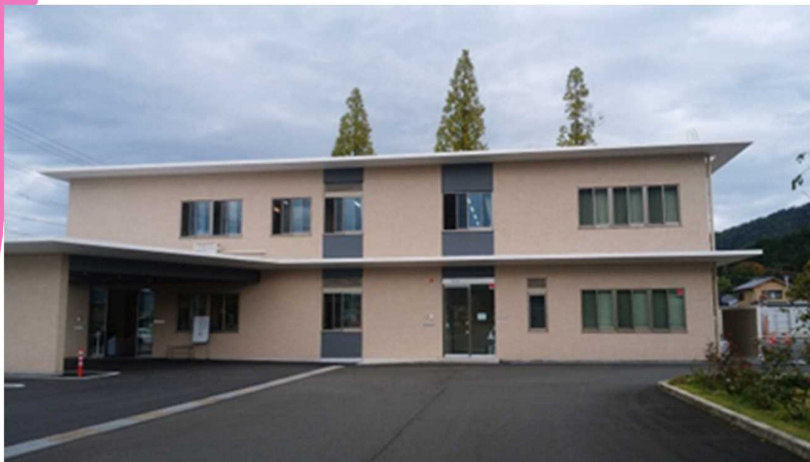
令和2年10月、西舞鶴倉谷に移転した医師会館