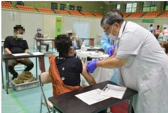
コロナワクチン集団接種