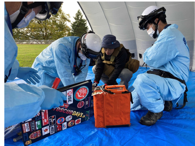
災害時医療（地域防災訓練に参加）