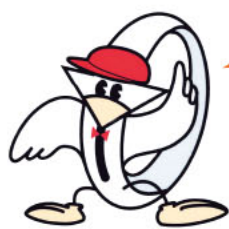
マイ・リサイクル店一覧 (2023年12月現在)

市では、ごみの減量やリサイクルに取り組んでいるお店を「マイ・リサイクル店」に認定しています。マイ・リサイクル店を利用して、ごみ減量に取り組みましょう。