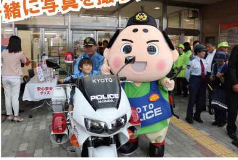
白バイ・パトカーの展示 (記念写真撮影可能)