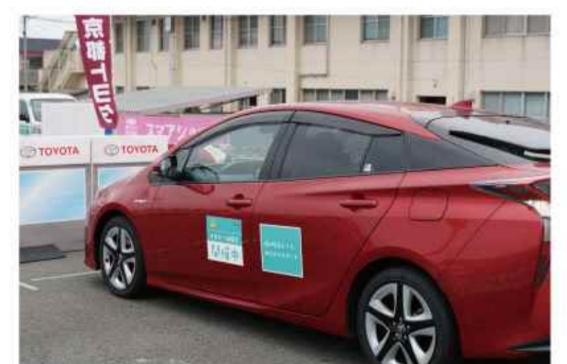
安全運転サポートカーの展示・ 乗車体験