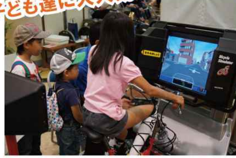
自転車シミュレータ体験 交通安全教室