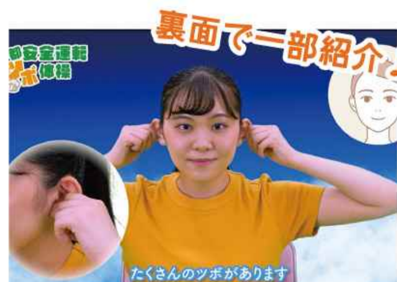
安全運転ツボ体操体験