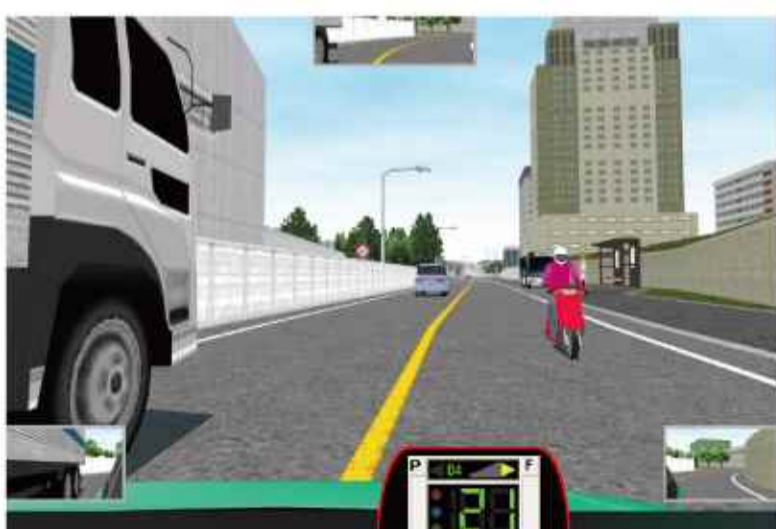
危険予測トレーニング体験

「より長く、より安全に！」をテーマに、「まだまだ運転がしたい」「生活に自動車が欠かせない」といった高齢ドライバーの皆さまがいつまでも安全に運転していただけるよう、サポートカーや危険予測トレーニングなどを実際に体験することで、ご自身の認知機能・身体機能を理解し、安全運転継続の意識を高めていただくためのイベントです！