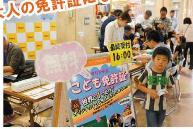
子ども免許証作成コーナー