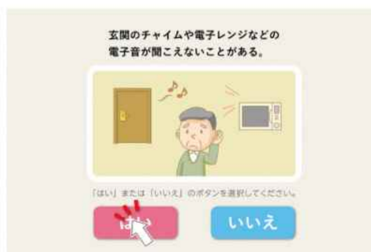
認知・身体機能低下抑制 トレーニング体験