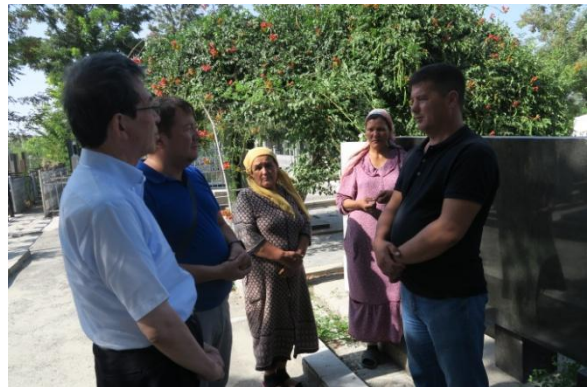
管理人の方に感謝の意を伝える