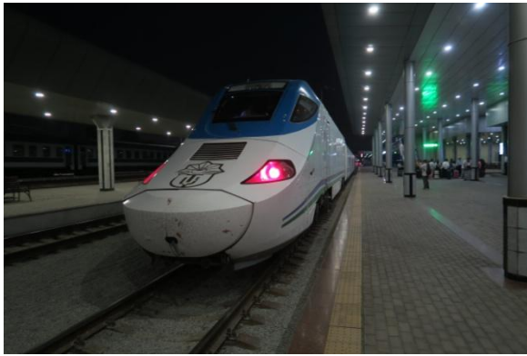
特急アフラシャブ号