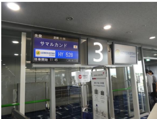
関西国際空港搭乗口

約8時間40分のフライトを経て、総勢35名の代表団・訪問団がサマルカンド国際空港に到着。空港では、2名の日本語ガイドが出迎えてくれました。