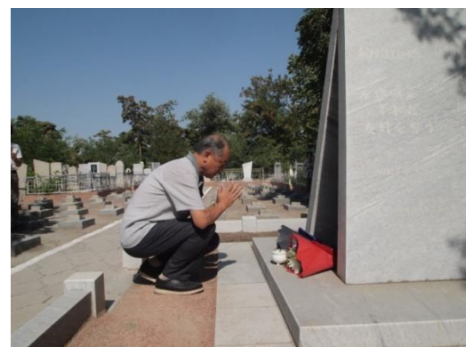
コーカンドの日本人墓地を参拝