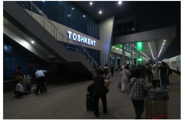
タシケント駅に到着