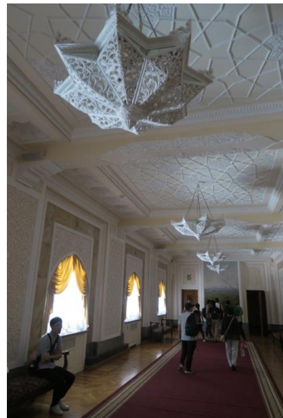
ナボイ劇場を見学