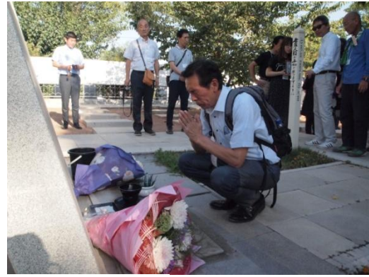
タシケントの日本人墓地を参拝