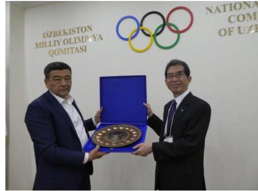
オリンピック委員会を訪問