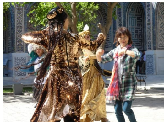
ウズベキスタン観光庁主催歓迎セレモニー