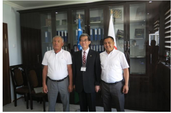
リシタン市役所を訪問