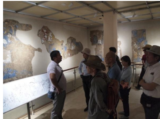
アフラシャブ博物館