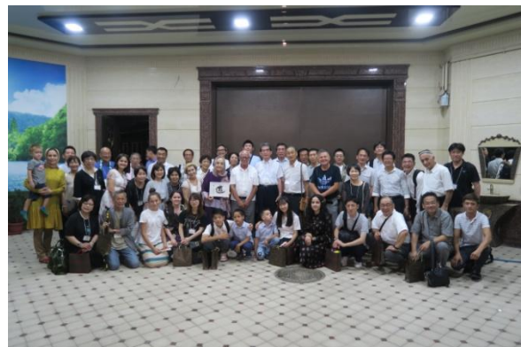
スルタノフ館長のご自宅に招待される