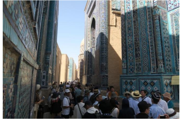
シャーヒズィンダ廟群