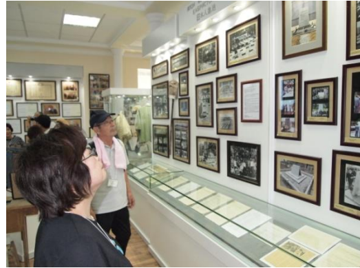
日本人抑留者資料館を見学