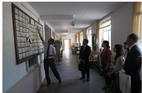
国立東洋学大学付属高校を訪問