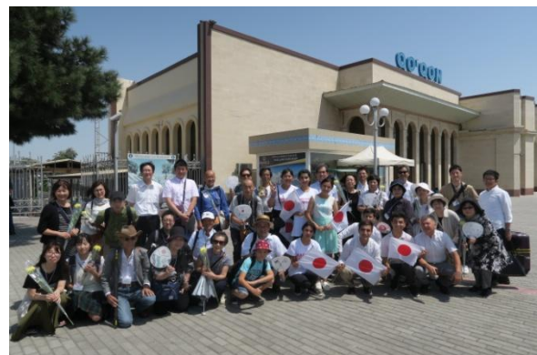
Noriko 学級の生徒たちが出迎え