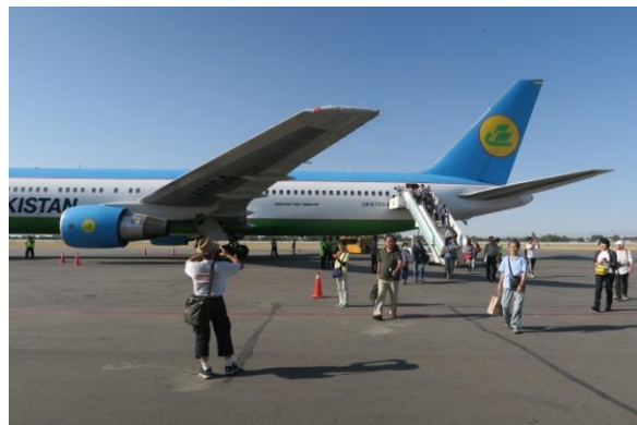
サマルカンド国際空港に到着