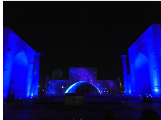
プロジェクションマッピング