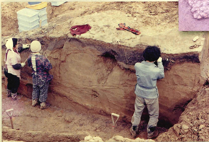
植物遺体の出土した粘土層

由良川は京都府北部最大の河川で、その流れは肥沃な大地を形成し太古より人々に恵みを与え続けてきましたが、肥沃な土壌は上流からの氾濫によってもたらされることから甚大な被害をもたらすものでもありました。しかし、その恵みに恩恵を受け人々は由良川沿いの高台（自然堤防）上に営みを続け、由良川下流域には縄文時代のムラがほぼ3km 間隔に城嶋遺跡、和江遺跡、八雲遺跡、大川遺跡、志高遺跡、桑飼下遺跡があることが知られています。