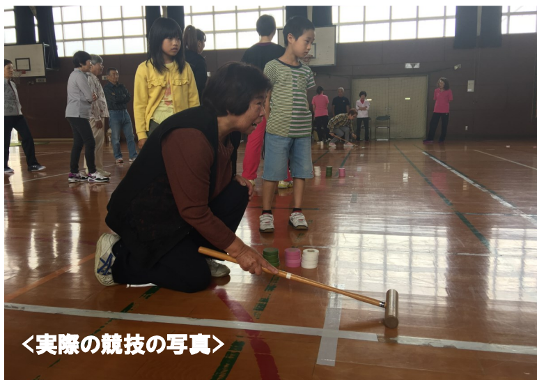
<実際の競技の写真>