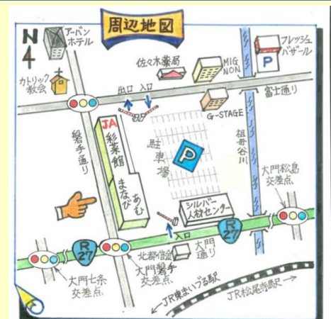
まなびあむ地図(作画:ロッキー氏)