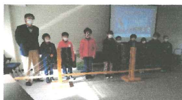
第7回レオナルドダヴィンチの橋を作ろう