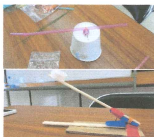
第2回投石マシン他