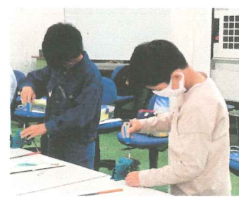
第4回 ホイッスル他