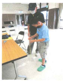
第1回マシュマロにチャレンジ

下記は2022年7月～2023年2月に開催した内容です。今年は何をするのかな? お楽しみに(●^o^●)