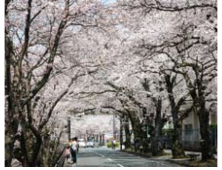
舞鶴医療センター前の桜のトンネル(昨年の様子)

まもなく桜が見ごろを迎える季節。市内の桜の名所を紹介いたします。 ◆東・中地区 ◆与保呂川沿い：約1,000本(下欄に関連記事) ◆共楽公園：約450本 ◆夕潮台公園：約250本 ◆青葉グリーンドーム：約200本 ◆東舞鶴公園：約180本 ◆引揚記念公園：約170本(引揚者の団体などから寄贈された八重桜約100本を含む) ◆自然文化園：約110本。黄緑色の花を咲かせる品種「御衣黄」がある ◆大波街道：約80本 ◆自衛隊隊橋：約70本 ◆舞鶴医療センター前：約50本からなる桜のトンネル。