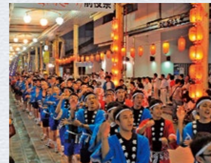
▲昨年の様子(左:民踊流し、右:手作りみこし)