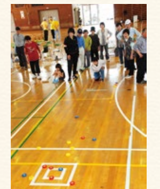
▲マイバックを楽しむ

【申し込み方法】4月21日（月）～5月14日（水）までに所定の用紙（スポーツ振興課、東・文化公園体育館などに備え付け。市ホームページからダウンロード可）で同課（☎66・1058）へ。