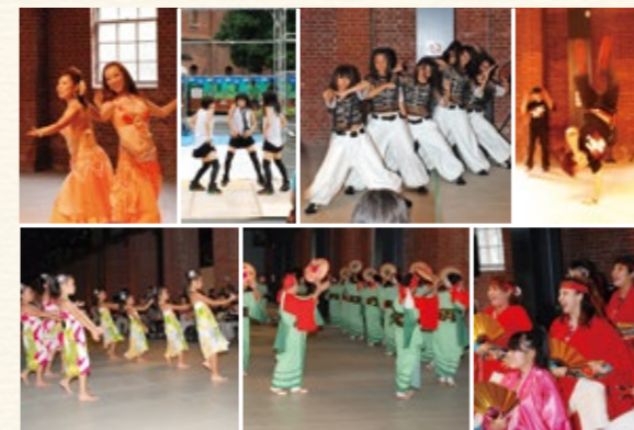
▲いろいろなジャンルのおどりが集合（昨年の様子）

【申し込み方法】6月30日（月）までに電話で舞鶴青年会議所事務局（☎77・1006）へ。