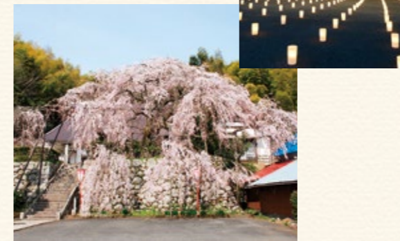
▲吉田のしだれ桜（左下）とキャンドルイルミネーション（右上）