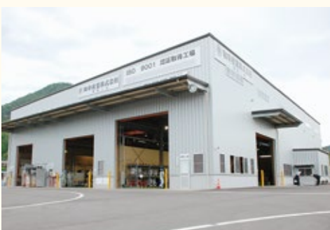
▲喜多工業団地に進出した和幸産業株式会社

その結果、平成24年4月には、喜多工業団地に和幸産業株式会社が入居し、操業を開始。また、倉谷工業団地で操業中のケンコーマヨネーズ株式会社が新たに製造ラインを増設するなど、約30人の雇用増加につながりました。