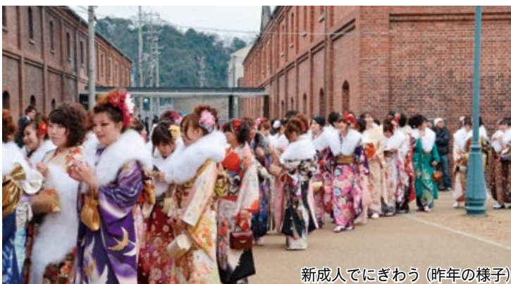
新成人でにぎわう(昨年の様子)

【お願い】当日、会場周辺は混雑が予想されます。速やかな乗降や乗り合わせ、公共交通機関の利用などにご協力ください。