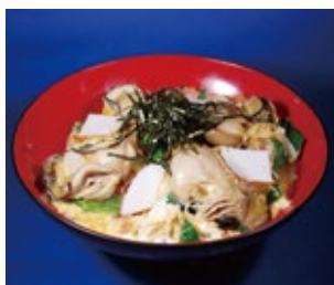
▲舞鶴かき丼のイメージ

舞鶴かき丼などが食べられるお店を紹介する「舞鶴かき丼マップ」を作製。JR東舞鶴駅観光案内所やまいづる観光ステーションなどで無料配布します。