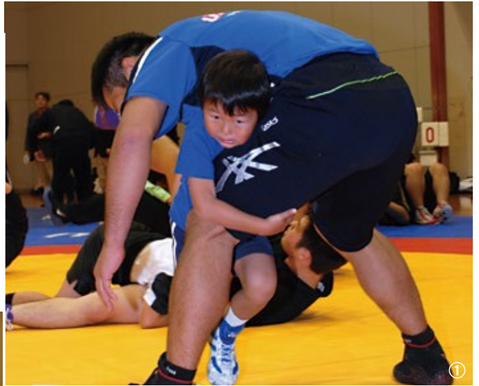
①松本選手にタックル ②日本代表選手のデモンストレーション ③高谷選手に教わる初めてのレスリング ④楽しみながら学ぶ ⑤みんなで基本動作

これは平成27年のインターハイ舞鶴開催と舞鶴市レスリング協会発足を記念して開催されたもので、ゲスト講師として招かれた日本代表選手の松本真也さんと高谷惣亮さんらが、子どもたちにレスリングの楽しさを教えました。