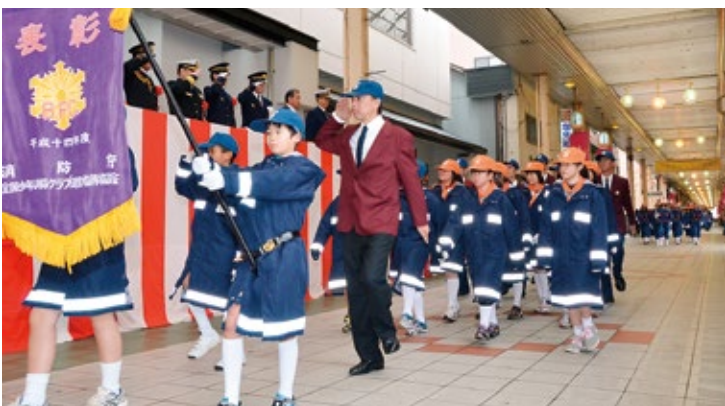
▲マナイ商店街での分列行進(昨年の様子)