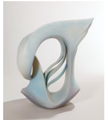
▲日展入選作品「滄望」

家の先生のもとで8年間学びました。私の歩みたい道は自分の表現方法で作品を創造してゆく「作家」になることだと確信し、日展や日本現代工芸美術展などに意欲的に挑戦してきました。