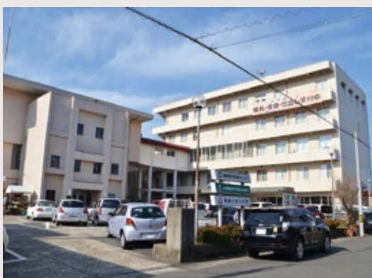
▲設置が予定されている勤労者福祉センター

同校は2年制の介護福祉士科と国際観光科(それぞれ1学年定員40人)と通信制の社会福祉士養成課程を開設。平成27年4月に開校する予定です。