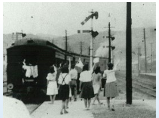
▲ホームの端で最後まで手を振る舞鶴市民

『私はこんなにも温かい出迎えを受けるとは予想もしていなかった。石の礫を投げつけられても文句は言えない敗戦の身への祖国の人達の思いやりの心に胸迫り、目頭を熱くしたのは私一人ではなかったようだ。』