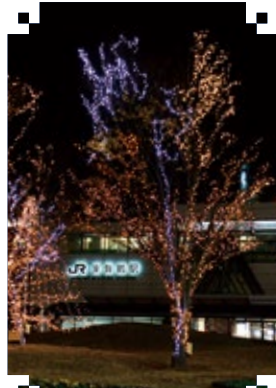
▲ JR 東舞鶴駅前の様子

時 2月28日(金)までの17時～24時(1月1日祝)～3日(金)は翌の時まで) 他 駅前イルミネーション・ショップ・写真展も同時開催 ( http://maizuruimn.jp/ )