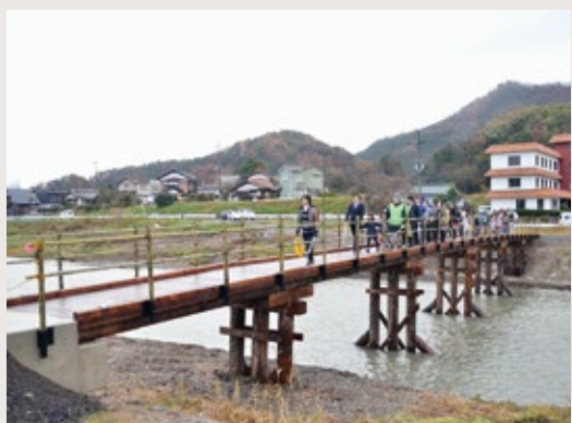
▲復旧した境谷橋を通る児童たち