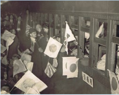
▲東舞鶴駅で引揚者を温かく送り出す様子

『引揚者が通る目抜き通りの所々には、婦人会員たちの献身的な湯茶の接待が行われ、いろいろと気配りされた。市民こそつてのこの運動に、きつとこの真心が通じるに違いない。』