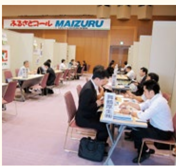
▲ふるさとコール MAIZURU (昨年の様子)

まちに人が暮らすには、そこに魅力的な働く場が必要です。今後とも、本市にある農林水産業や商工業、観光など、さまざまな分野における働く場の創出に取り組み、「任んでよし、働いてよしの選ばれるまちづくり」に努めていきます。