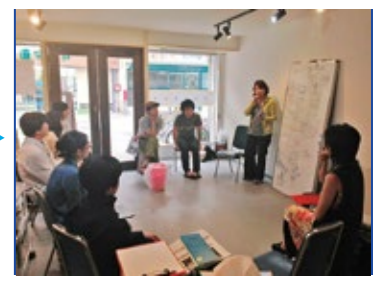
▲アートスクールの様子

パフォーマンスは会場内の複数か所で行います。当日の13時から、八島アートポートで配布する「パフォーマンスマップ」と「スケジュール表」を片手にパフォーマンスをお楽しみください。