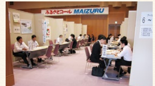
▲面接会場(昨年の様子)