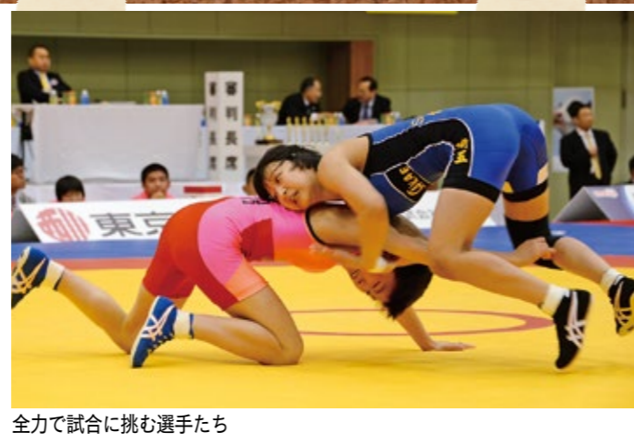
全力で試合に挑む選手たち