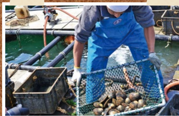
丹後とり貝の選別作業

また、約3年間育成され、紫外線殺菌装置で生食用処理がなされた「育成岩がき」も4月24日から出荷が始まり、8月（予定）までに約15万個の出荷が見込まれています。