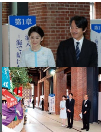
記念式典が行われた7月24日には、秋篠宮同妃両殿下が舞鶴を御訪問されました。