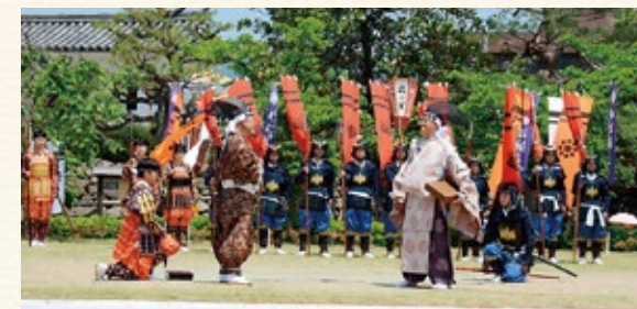
▲古今伝授の小芝居（昨年の様子）