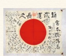
▲日の丸の寄せ書き