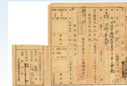
▲舞鶴引揚援護局で発行された引揚証明書