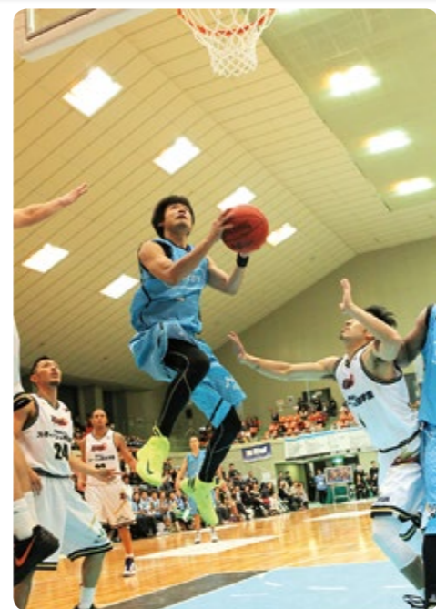
▲ディフェンスをかわしシュートする京都ハンナリーズの選手(昨年の様子)