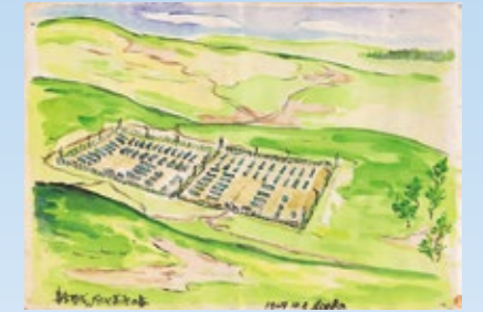
▲シベリア抑留中に描かれた絵画(収容所の全景)