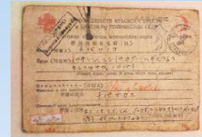
▲シベリアの収容所で日本人捕虜に配布された往復はがき。検閲があるため全文カタカナ書きになっているものもある。厳しい寒さや労働、劣悪な食糧事情について書くことは許されなかった