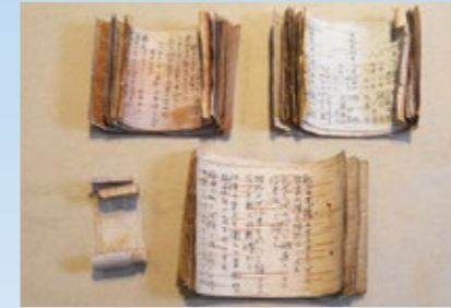
▲シベリア抑留中の日々の様子や心情を文章や和歌などでつづった日誌。紙の代わりに白樺の皮をはいでノートにし、ペンを空き缶で作った、インク代わりに収容所のストーブのすすを水に溶いて作成された