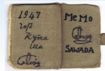
▲シベリア抑留で同じ収容所にいた日本人の氏名などを記したメモ帳。没収されないように靴の中に隠して持ち帰ったもの