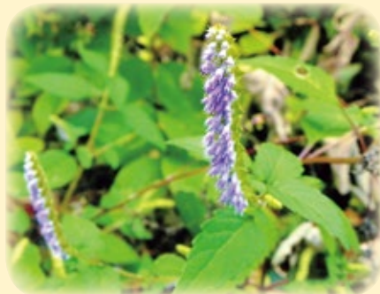
ナギナタコウジュ (シソ科)