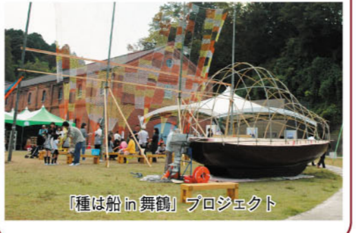
「種は船 in 舞鶴」プロジェクト

◆日比野克彦監修「種は船～航海プロジェクト from 舞鶴」…19日、11時30分から(荒天の場合は20日に延期)。3年がかりの計画を進めてきた「種は船 in 舞鶴」の新潟への出港之日比野さんによるレクチャー。赤れんが3号棟(まいづる智恵蔵)では、これまでの軌跡をパネルで紹介(5月31日(木)まで)。