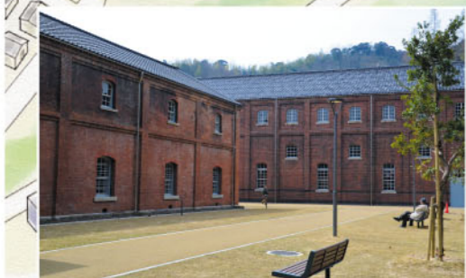
▲4号棟西側にはベンチや街灯を設置し、くつろげるスペースに