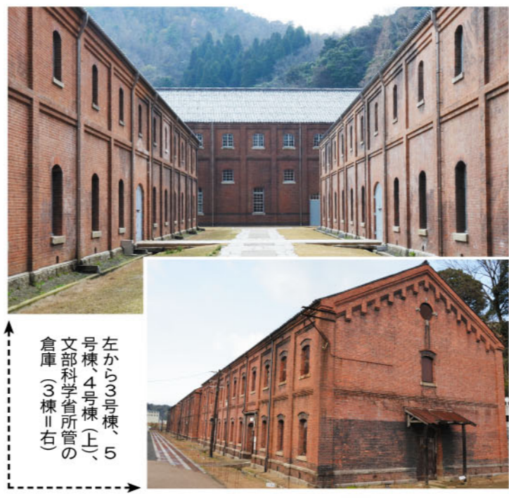
▲引き込み線のレールを復元