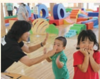
▲全部みついたらハイタッチ

形や色の違いをよく見たり、最後まで見つけきることで、集中力や観察力が育ちます。また、探しまわることで、普段あまり見ていない所に気付くかもしれません。