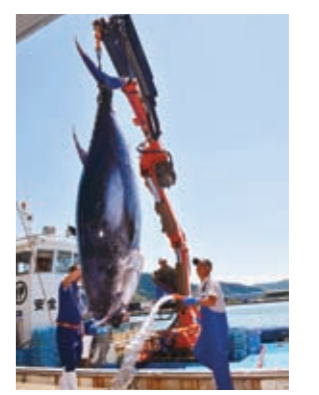
6月3日、府漁協舞鶴地方卸売市場に大型のクロマグロ41尾が氷揚げされました。近年まれに見る豊漁で328kgの超大物も。京都中央卸売市場や東京築地市場に出荷されました。