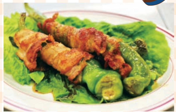
1人分 284* kcal 塩分 1.9g*