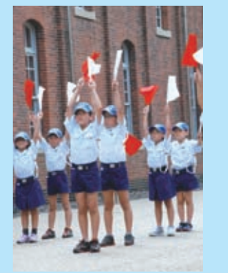
7月18日、赤れんがパークで行われた「海の日のつどい」で、舞鶴海洋少年団による手旗信号などの実演が披露されました。