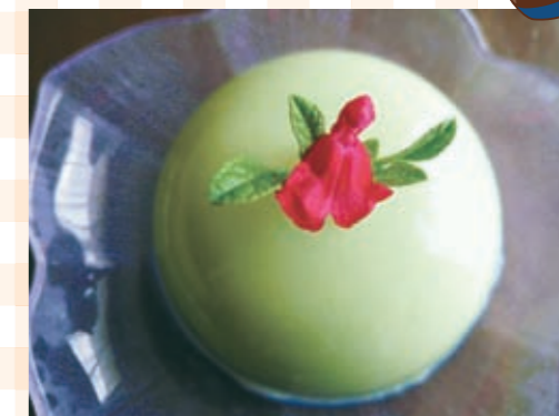
1人分 108kcal 塩分0.1g