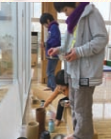
▲台の上に立ち豆をストンと落とす

ニューすトンは、豆を上から落として器に入れるだけの単純なあそびですが、入ったときはなんだか気持ちがいいあそびです。