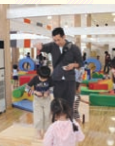
▲大人も子どもも楽しい

一見ムダなようにも見えますが、器を狙う目は真剣そのもの。その中で、知らず知らず集中力や距離感・方向感覚が育ちます。また、器によってはねる豆の音の違いにも気づくことができます。