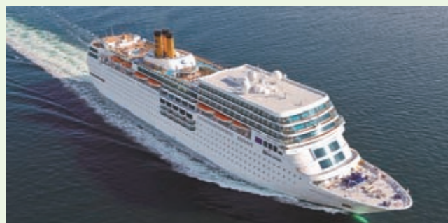
▲コスタ ネオロマンチカ (コスタクルーズ社・伊) 総トン数：56,769トン、全長：221メートル、乗客定員：1,572人

4月～10月に舞鶴に32回入港するイタリア船籍のクルーズ客船「コスタ ネオロマンチカ」の船内見学を実施します。 【日時】 7月15日(土)、22日(土)14時30分～16時30分 【場所】 京都舞鶴港西港第2ふ頭 【対象】 階段の昇り降りを含む1時間程度の団体見学が可能な人 【定員】 各回50人(多数の場合抽選) 【申し込み方法】 希望の見学日、応募者全員の住所、氏名(ローマ字も)、生年月日、電話番号、国籍、当日有効なパスポート番号を封書で〒625-8555(住所不要)みなと振興・国際交流課「コスタ ネオロマンチカ見学会係」へ。市ホームページからも応募可。6月23日(金)15時必着。1通につき5人まで応募可。未成年者は保護者の同伴が必要。 ▶詳しくは、同課(☎66・1037)へ。