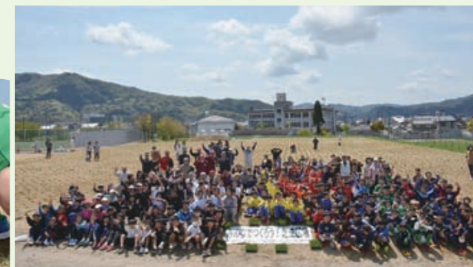
▲参加者全員で記念撮影