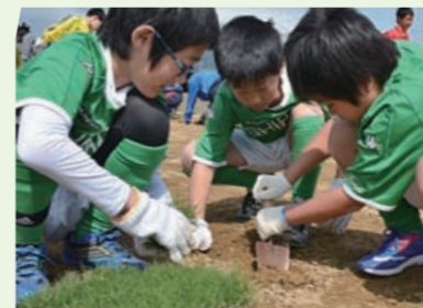
▲芝生苗の植え付けの様子