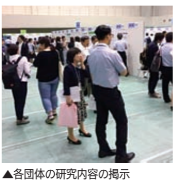
▲各団体の研究内容の掲示

本市では、平成27年の「乳幼児教育ビジョン」の策定をきっかけに、保幼小中の保護者・教員が、公私、園校種の枠を超えて共に学び合う研修や保幼小接続カリキュラム研究など、大学の研究者と連携して取り組んでいます。また、乳幼児教育の質向上の取り組みとして、公開保