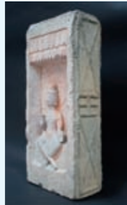
仏像浮彫博 (3世紀頃)

舞鶴市と大連市(中国)の友好都市提携35周年を記念した企画展「中国の博」を開催。中国で建築用のれんがやタイルを意味する「博」を紹介。万里の長城に使われていた博や仏像・動物が浮き彫りされた博、墳墓に使用されていた文様博などを展示。