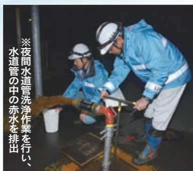
※夜間水道管洗浄作業を行い、水道管の中の赤水を排出

水道管の老朽化のため、水道水が茶色く濁ったりお風呂の底に砂粒状の鉄錆がたまるなど、赤水が発生することがあります。上下水道部では、水道管を更新するとともに、昼夜を問わず職員が水道管の洗浄作業を行い、赤水の発生防止に努めています。