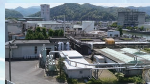
▲今年度事業を実施する東浄化センター