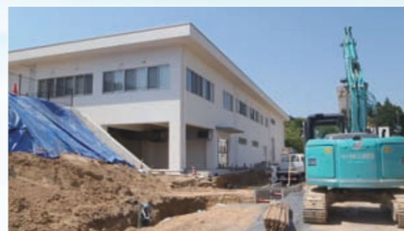
▲施設更新中の上福井浄水場管理センター