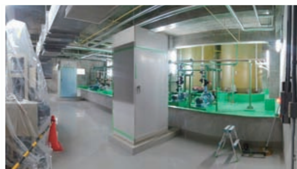
▲管理センター内薬品注入室