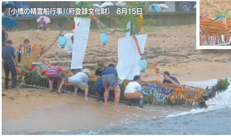
「小橋の精霊船行事」(府登録文化財) 8月15日