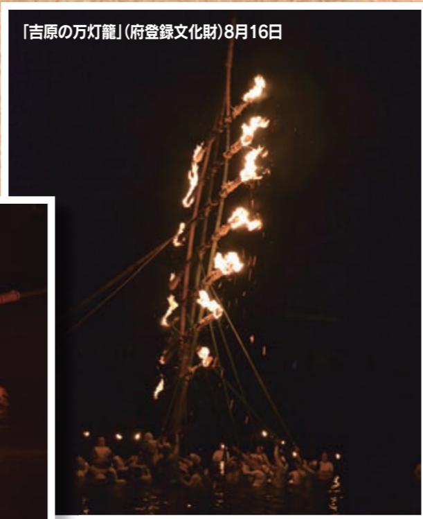
「吉原の万灯籠」(府登録文化財)8月16日