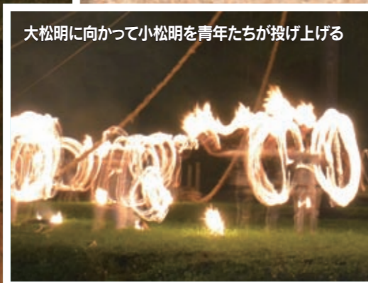
大松明に向かって小松明を青年たちが投げ上げる