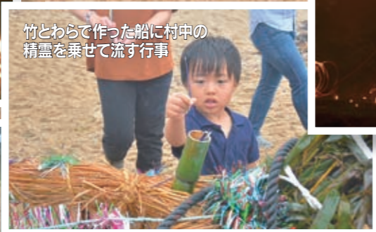
竹とわらで作った船に村中の精霊を乗せて流す行事