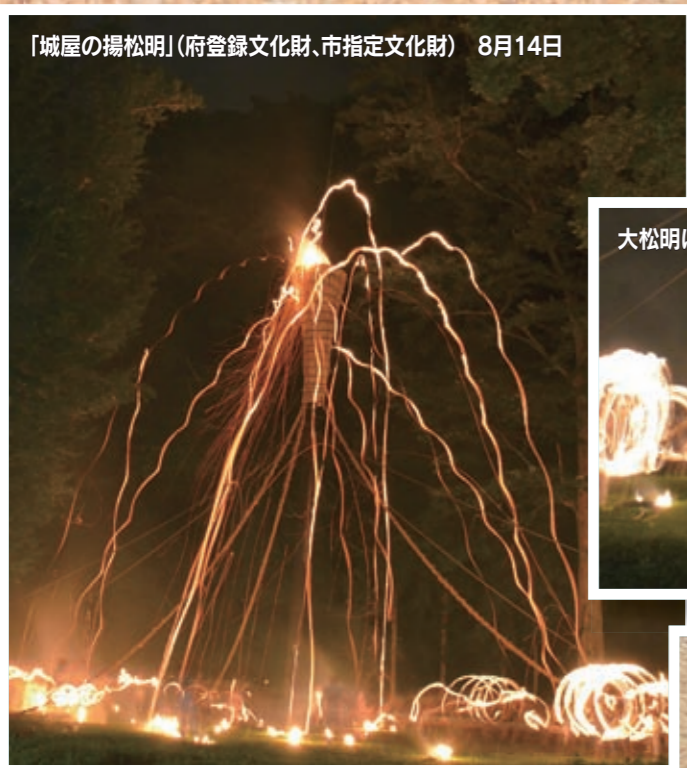
「城屋の揚松明」(府登録文化財、市指定文化財) 8月14日