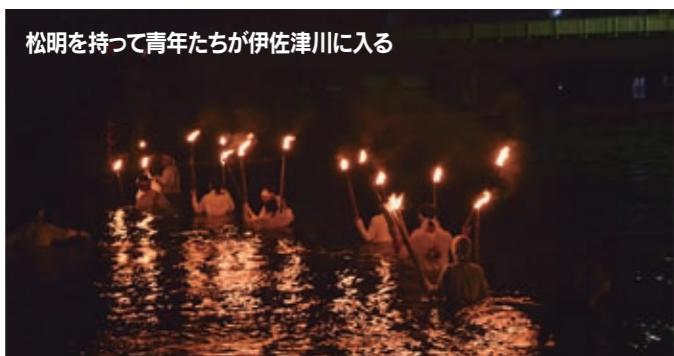
松明を持って青年たちが伊佐津川に入る