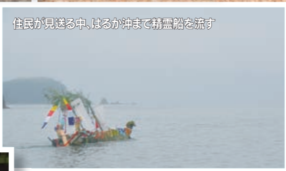
住民が見送る中、はるか沖まで精霊船を流す