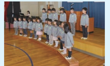
私立幼稚園就園奨励費補助 【1億6,550万円】 子育て支援の一環として、保護者負担の軽減措置を実施