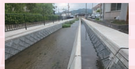
河川整備事業 【1億5,362万円】 安岡地区水路や静溪川をはじめ、市内河川・水路の改修や測量など