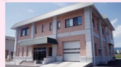
し尿処理施設改築事業 【4億9,968万円】 環境衛生プラントの建設（平成29年8月竣工、総事業費は約12億5,000万円）