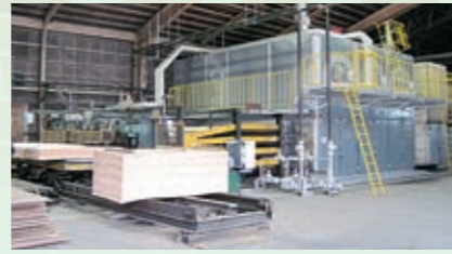
林業・木材産業等振興施設整備交付金 【2億4,090万円】 木材処理加工施設の整備に対する補助（合・単板加工施設装置）