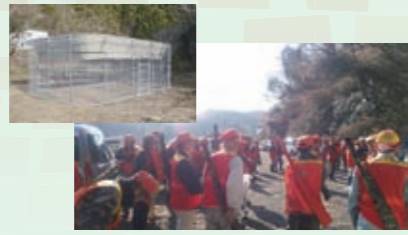
有害鳥獣被害防止対策事業 【5,013万円】 サル追い払いパトロールや撃退用具購入に対する補助、鳥獣捕獲に対する報償金など