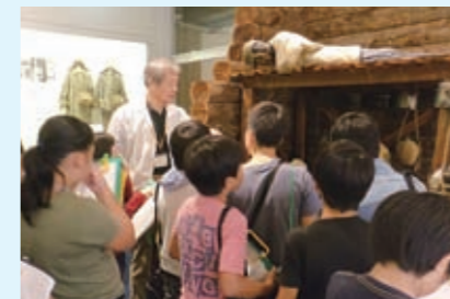
特色ある教育活動支援事業費補助 【701万円】 学校アドバイザーの配置やふるさと学習、職場体験学習の実施を支援