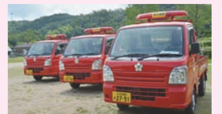
消防施設整備事業 【2,727万円】 消防ポンプ自動車（1台）や小型動力ポンプ搬送車（3台）の整備など