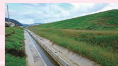
由良川水防災対策促進事業 【3,150万円】 道路と宅地のかさ上げや志高排水路などを整備