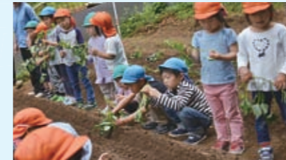
保育の質向上に係る保育士確保支援事業費補助 【639万円】 保育サービスの充実に向け、年度当初の保育士確保を支援