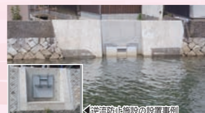
西地区浸水対策事業 【2,377万円】 水位監視装置や逆流防止施設を設置、宅地かさ上げ助成など浸水軽減への対策を推進