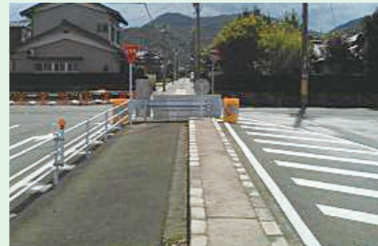
幹線道路整備事業 【3億9,680万円】 引土境谷線、和泉通線の整備に向け、用地取得や道路を改良