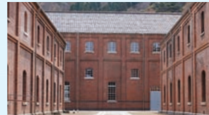
地方創生拠点整備事業 【2,097万円】 赤れんがパークを中心としたまちづくりの基本計画策定など