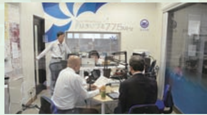
まち・ひと・しごと創生総合戦略推進事業 【2,284万円】 北部連携の推進、FMまいづるを活用した情報発信など