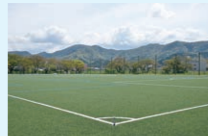
都市公園整備事業 【2億6,034万円】 （仮称）西運動公園の整備や青葉山ろく公園などの長寿命化対策