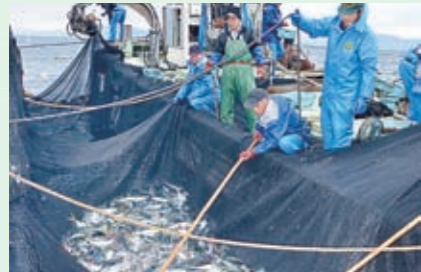
漁業体質強化支援事業費補助 【753万円】 レーダーや定置網などの購入支援、アワビの稚貝の放流やカキなどの検査