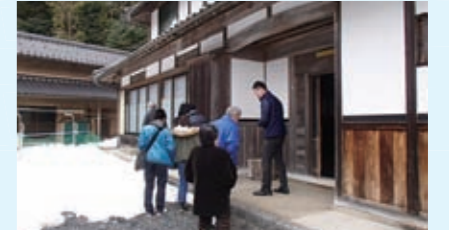
農村移住者受入促進事業 【179万円】 空き家の改修費や受け入れ自治会への補助などを通じ、移住者受け入れを促進