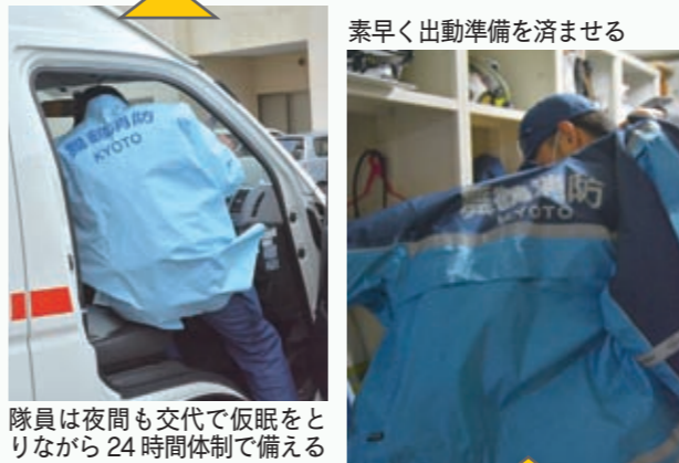
素早く出動準備を済ませる