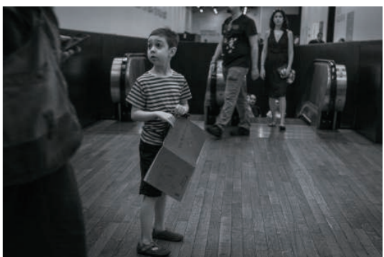
▲ロンドンで撮影したスナップ写真(左上も)

市長 東は海軍から発展したまち、一方で西は城下町文化に育まれたまち、加佐には農村の風景、大浦には漁村の風景が素晴らしい風景もよかったです。 市長 東は海軍から発展したまち、一方で西は城下町文化に育まれたまち、加佐には農村の風景、大浦には漁村の風景が素晴らしい風景もよかったです。 市長 東は海軍から発展したまち、一方で西は城下町文化に育まれたまち、加佐には農村の風景、大浦には漁村の風景が素晴らしい風景もよかったです。