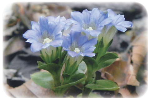
フデリンドウ (リンドウ科)