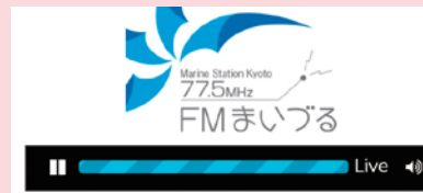
▲スマートフォンやPCからも聞ける