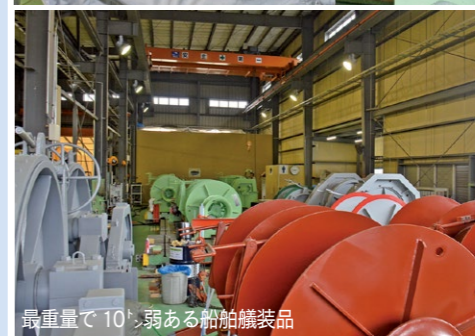
最重量で10tある船舶艦装品