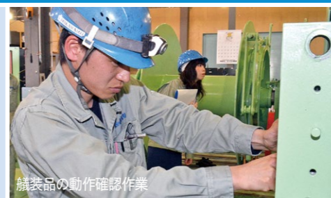
艦装品の動作確認作業

※船舶艦装品…手すりや階段のほか、甲板機械と呼ばれる船のいかり、ロープを巻き上げる装置など船の甲板上にあるさまざまな部品のこと