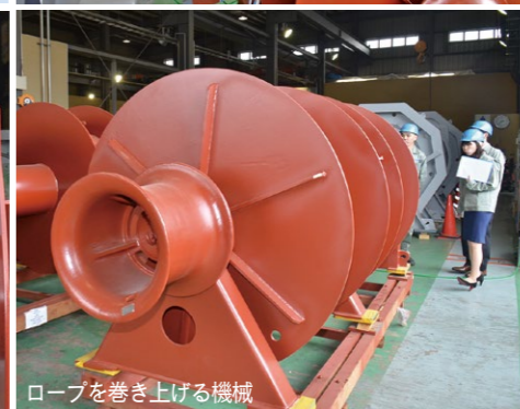
ロープを巻き上げる機械