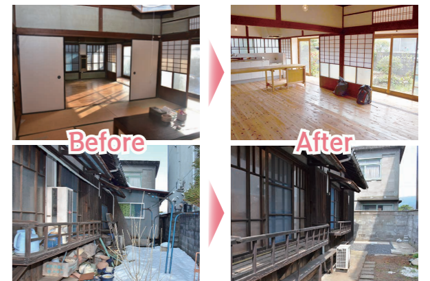
上) お試し住宅の畳の部屋とフローリングの部屋 下) 増築か所を撤去し、すっきりとした外観になった裏庭