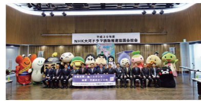
▲NHK大河ドラマ誘致推進協議会総会の様子(4月26日、長岡京市)

2020年NHK大河ドラマが「麒麟がくる」に決定。明智光秀が主人公で、京都府北部4市を含む11市町と各自自治体の関係団体で構成するNHK大河ドラマ誘致推進協議会が誘致に向けて行ってきた活動が実を結びました。市としても、明智光秀の盟友である細川幽斎ゆかりの地として、観光振興や地域活性化に向けての取り組みを進めています。《観光商業課》