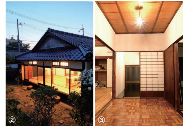
お試し住宅は、旧海軍宿舎として昭和13年に建てられた木造平屋建て住宅。延床面積は89平方メートルで敷地面積は305平方メートルの2LDK。 ①前庭から眺めた住宅③玄関

場1台分ほどのスペースがあること◆昭和56年6月以降(新耐震基準)の戸建物件が望ましい 【その他】要件などの書類審査と建物内を含めた現地調査で採否を決定。借り上げ期間中に居住者から購入の希望があった場合、相談に応じられる人で、借り上げ期間中に相続が発生した場合でも相続が可能であることを希望します。不動産業者が扱っている物件も受け付け。