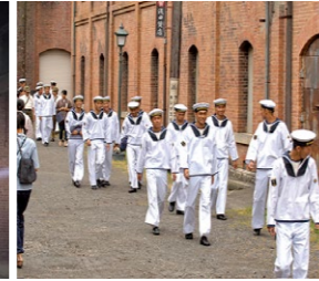
▲FCでは赤れんがなど舞鶴ゆかりのロケーションを生かしてさまざまなロケを誘致

ン(FC)でのノウハウを生かし、施設と音楽業界のマッチングを支援することで、交流人口の増加による経済効果の拡大や音楽を通じた地域イメージアップなどによる地域活性化