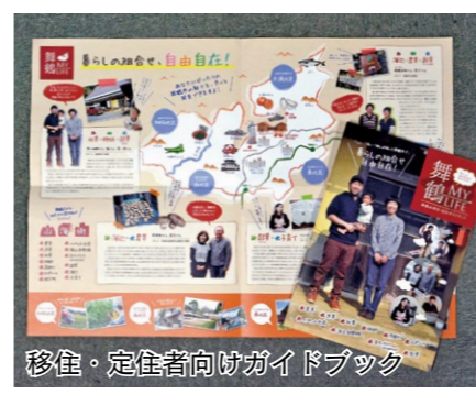
移住・定住者向けガイドブック

名称は「舞鶴 MY LIFE 舞鶴市移住・定住ガイドブック(A2判、4ツ折りフルカラー、2,000部)。市役所、西支所、加佐分室に配架。移住・定住ポータルサイトでも閲覧できます。