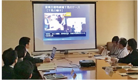
▲設立総会で音楽合宿の下見対応事例を紹介

市では、舞鶴商工会議所、舞鶴観光協会、(公財)舞鶴市文化事業団と共同で「舞鶴ミュージックコミッション(MC)」を設立しました。音楽業界や旅行業界と連携し、各業界関係者に対し音楽イベント、音楽合宿、ミュージックビデオの撮影を誘致するための情報発信と受け入れの支援を行うMCの設立は全国初の取り組み。2002年から「海賊とよばれた男」や「日本のいちばん長い日」などの映画撮影のロケを誘致してきた「舞鶴フィルムコミッション」