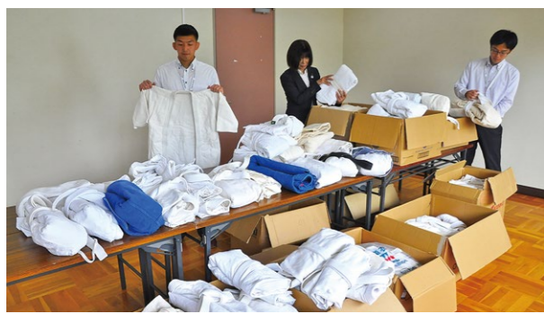
▲子ども用サイズから大人向けまで幅広いサイズの柔道衣を提供いただきました

2020(平成32)年の東京オリンピック・パラリンピックでレスリング・柔道のホストタウンに決まった相手国