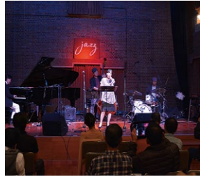
▲赤れんがの雰囲気を活用したジャズイベントを定期的に開催

市では、舞鶴商工会議所、舞鶴観光協会、(公財)舞鶴市文化事業団と共同で「舞鶴ミュージックコミッション(MC)」を設立しました。音楽業界や旅行業界と連携し、各業界関係者に対し音楽イベント、音楽合宿、ミュージックビデオの撮影を誘致するための情報発信と受け入れの支援を行うMCの設立は全国初の取り組み。2002年から「海賊とよばれた男」や「日本のいちばん長い日」などの映画撮影のロケを誘致してきた「舞鶴フィルムコミッション」