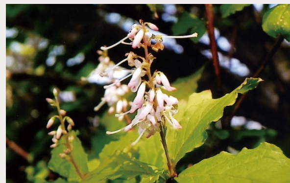
ホツツジ (ツツジ科)

各地の山地の林縁や岩場などに生える落葉低木。細かく枝分かれし、若い枝は赤みを帯びる。葉は互生し、楕円形で長さは2~6cm、先は鋭くとがる。夏から秋にかけて枝先に円錐花序をだし、たくさんの花を付ける。花は白色で赤みを帯び、花弁は深く3裂して細長く反り気味に開く。日陰に咲くものは赤みを帯びない。雄しべは6本、雌しべは長く突き出る。名前の由来は「穂ツツジ」で花の様子から。別名は「ヤマホウキ」で枝を箒として使ったことから。