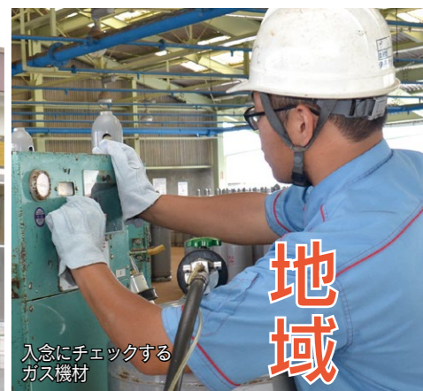
入念にチェックするガス機材