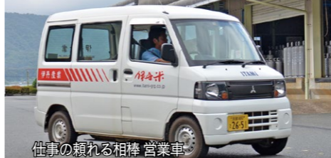
仕事の頼れる相棒 営業車