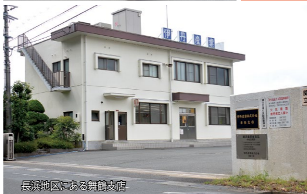
長浜地区にある舞鶴支店