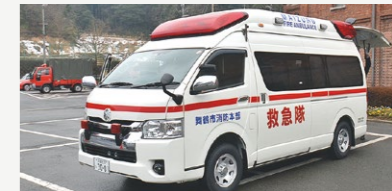
消防施設整備事業【6,273万円】 高規格救急車、消防ポンプ自動車の更新、小型動力ポンプ搬送車3台整備