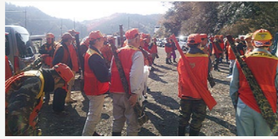
有害鳥獣被害防止対策事業【5,524万円】 イノシシ・シカ・サルなどの農作物被害防止の取り組み