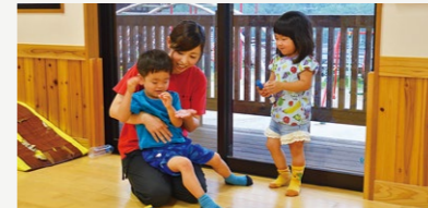
保育士の処遇改善事業費補助【1,966万円】 人材不足解消を目的とする民間園保育士等の処遇改善に対する支援を市独自で実施