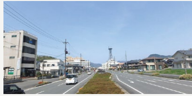
幹線道路整備事業【1億7,776万円】 国道・府道を補完する幹線市道（引土境谷線・和泉通線）の整備