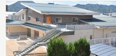
公立認定こども園整備事業【1億2,427万円】 幼保連携型認定こども園の整備に係る建設事業費