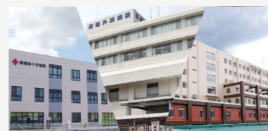
公的病院救急医療体制確保事業費補助【4,500万円】 地域医療を維持・確保するため公的3病院の平日夜間等の救急医療体制確保を支援