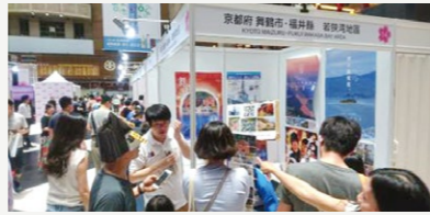
舞鶴観光ブランドプロモーション戦略事業【2,876万円】 首都圏などでの誘客プロモーションや外国人観光客誘致の強化