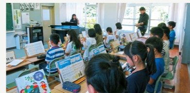
小中一貫教育推進事業【685万円】 城北・加佐・青葉・和田の4中学校区で実施