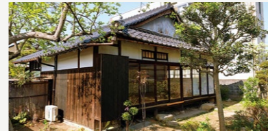
移住定住促進事業【2,153万円】 市外からの移住希望者に住居の貸し出しや空き家の改修費用を助成（12世帯、26人が移住）