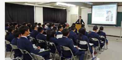
夢チャレンジサポート事業【2,438万円】 夢を考えるきっかけとするため、外部講師の講演会を実施