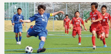
都市公園整備事業【2億7,230万円】 伊佐津川運動公園の管理棟・芝生広場等整備、共栄公園園路舗装ほか