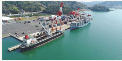
京都舞鶴港整備事業費負担金【4,000万円】 京都舞鶴港の物流機能向上に向けた臨港道路和田下福井線整備負担金