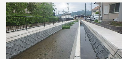
河川整備事業等【2億2,571万円】 浸水被害の解消に向けた市内一円の河川整備など