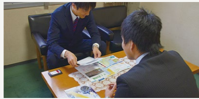
企業誘致実現プロジェクト事業【3,467万円】 雇用を伴う新規立地や設備投資に対する助成を市内全域に拡大し実施