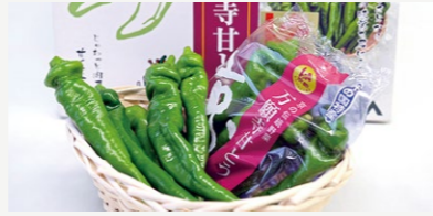
万願寺甘とう振興事業【2,210万円】 舞鶴発祥のブランド野菜の生産拡大のため施設整備等を支援