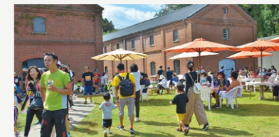
地方創生拠点整備事業【4,583万円】 赤れんかパークを中心とした整備計画の策定と民間活力導入調査