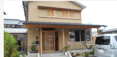
地域密着型サービス拠点施設整備費補助【3,572万円】 小規模多機能型居宅介護事業所を整備した法人に対し助成