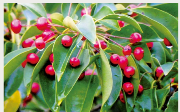
ソヨゴ (フクラシバ) (モチノキ科)

関東以西の山地の乾いた林内によく見られる常緑の小高木。高さは4~10m、葉は互生し長さ4~8cm程度の卵状楕円形で先は尖る。鋸歯はなく表裏とも無毛。雌雄異株。夏、葉腋に雄花は3~8個、雌花は1個の白色の小さな花を付ける。果実は径8mmほどの球形で秋遅くに赤く熟する。名前の由来は、堅い葉が風にそよいで音を立てることから。別名「フクラシバ」は、火であぶると表皮が丈夫なため葉内の水分が水蒸気となり葉が膨らむことから。