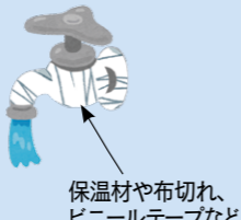
保温材や布切れ、 ビニールテープなど