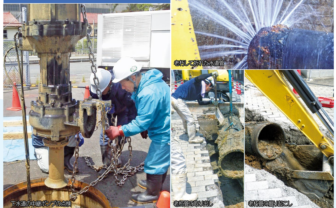
老朽して折れた水道管