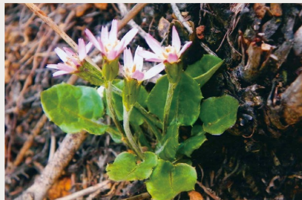
センボンヤリ(ムラサキタンポポ) (キク科)

山地の日当たりの良いところに生える多年草。葉はロゼット状(※1)で根生する。春の葉は小さく、少数の切れ込みがある。秋には葉が大きくなり羽状になる。花は春型和秋型があり、春型は5~10個ほどの花茎を数本出し、径1.5cm位の白色で裏面が紫色を帯びている。秋型は花茎を長く伸ばし、筒状花のみの閉鎖花(※2)で種を付ける。