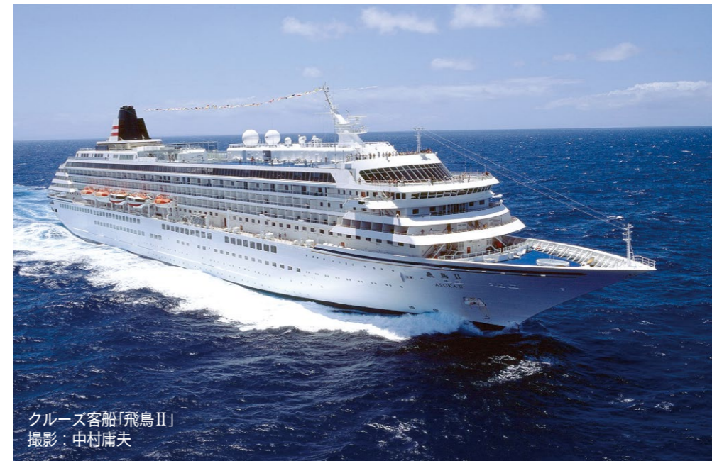
クルーズ客船「飛鳥II」