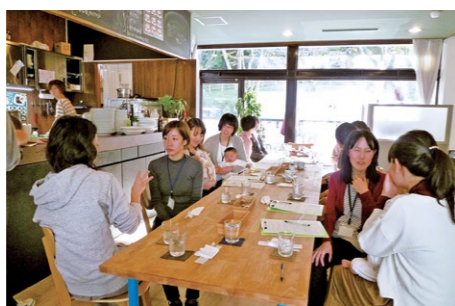
▲ヨーガや座談会で子育て中のママをサポート