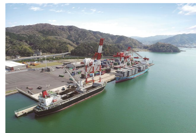
▲コンテナ船とバルク船(ばら積み船)が同時に着岸する舞鶴国際ふ頭

◆特別割引の対象 府内在住が在勤の人(1人以上を含むグループ) ◆申し込み方法 4月10日(水)までに電話でクラブツーリズム(株)☎03・5323・5222へ。 ▼詳しくは、京都舞鶴港クルーズ誘致協議会事務局(みなと振興・国際交流課内)☎66・1037へ。