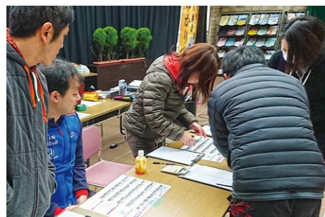
▲フォトロゲイニングの受け付けの様子。スポーツしながら西舞鶴地区を再発見