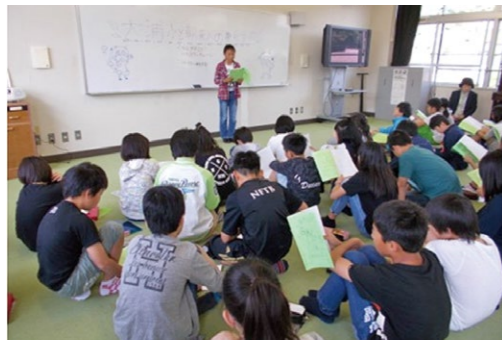
上) 小・中学校教員の合同研修会 (白糸中学校区) 中) 中学校の1日体験入学 (城南中学校区) 下) 合同修学旅行の事前学習 (若浦中学校区)

市では、義務教育9年間を連続した期間と捉え、子ども達の発達段階に応じた一貫性のある学習指導・生徒指導を小学校と中学校が協力して行う「小中一貫教育」に取り組み、学力の定着と学校生活への適応を目指しています。平成28年度から各中学校区に順次導入し、今年度は白糸・城南・若浦中学校区でスタートしました。