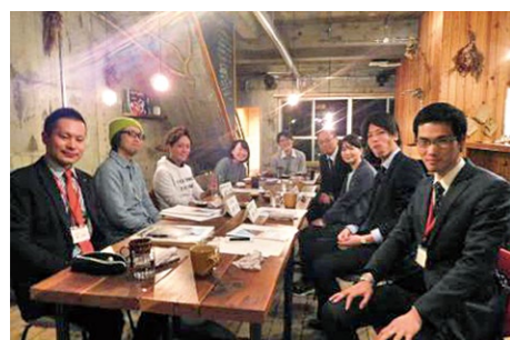
▲市内で働く若者を紹介するMAIZURU WORK NOTEの取材の様子。完成品は市内の高校に配布

政策づくり塾では、今後は「舞鶴をよりよいまちにするには何が必要か」「自分たちは何ができるのか」などのまちづくりを学び実践していきます(16ページに関連記事)。