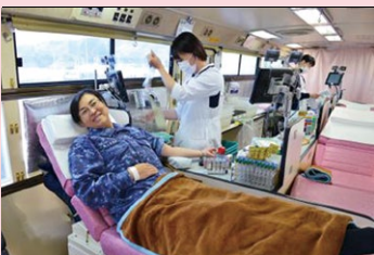
自衛隊の皆さんにも協力してもらっています。

1月16日(木) 9時30分～11時30分、12時30分～15時30分に市役所で「はたちの献血」キャンペーンの一環として「新春舞鶴市100人献血」を実施。一人でも多くの人を救うため、ぜひ献血にご協力ください。その他の献血日程もカレンダー(31頁)に掲載。