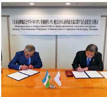
▲ソリエフ長官と覚書を交わす

覚書の中で、リシタン地方の栽培技術の普及に向けた協力のほか、介護福祉や産業技術に関する人材育成について確認。また、12月16日にシヤフカット・ミルジョー