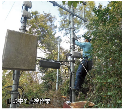
山の中で点検作業