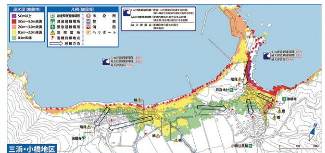
▲三浜・小橋地区の津波ハザードマップ

市では、津波ハザードマップを作成し、ホームページで公開しています。津波による浸水の深さや到達時間の目安も掲載。住んでいる地域や通勤・通学場所、経路を確認してみてください。下コードからもアクセス可。