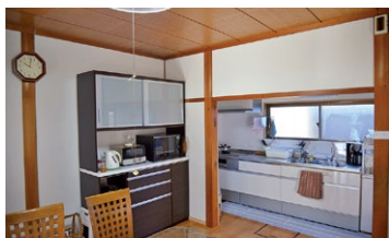
▲水回りや畳のリフォームとシロアリ対策などで安心して住める家に

住希望者をつなぐ取り組みに力を入れている。また、空き家情報バンクでは、売却だけでなく、借家での登録も募集している。今は住む人がいない、また、家を手放す決断に踏み切りがつかないという場合に適している。移住希望者にも、最初は賃貸で慣れたら定住先を決めたいという人も多く、賃貸物件の需要は大きい。 そこで、実際に空き家情報バンクに登録された家が新しい家族の暮らしへとバトンタッチした事例を紹介。 もし、自身や親戚などに、空き家を手放せない人がいるなら、移住者を受け入れる起点という選択肢も考えてみてもらいたい。