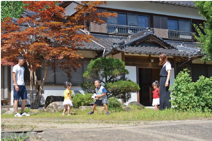
▲草引きが大変だったという庭は子ども達の遊び場に