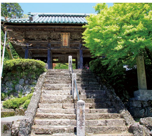
松尾寺…真言宗醍醐派の寺。国宝や重要文化財の絵画・彫刻を多数所蔵。毎年5月8日に催される「仏舞」は有名。