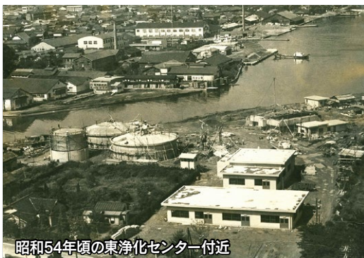
昭和54年頃の東浄化センター付近