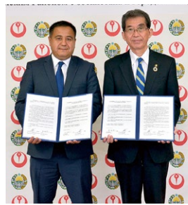
▲アブドゥラフモノフ副知事と覚書を交換

ウズベキスタンのフェルガナ州リシタン地方にある日本語教室「NORIKO学級」との交流を契機に、市民同士で交流が進んでおり、今後のさらなる友好関係の深化に向け、11月19日にアブドゥラフモノフ副知事と覚書を交換しました。