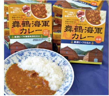
提供：(有)ハヤシスポーツ スマイルSS (市内字引土300、☎75・4173)

市内の事業所が厳選した牛肉と地元の純米酒を使用した舞鶴海軍カレーです。味は、厳選ビーフと純米酒を使用した「やや甘口」と厳選ビーフのみの「中辛」の2種類。舞鶴でしか表現できない味をぜひご賞味ください。五老スカイタワーなどで販売。