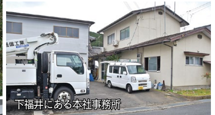
下福井にある本社事務所