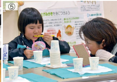
①休日にあそびあむで遊ぶ親子②公開保育で他の園の様子を学ぶ保育士③子育て広場で親同士の交流④ドキュメンテーションで保育を可視化⑤歯科検診で磨き方を学ぶ⑥子育て教室でリフレッシュ