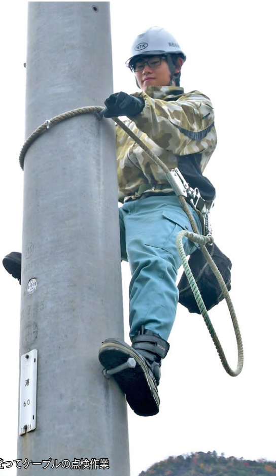
電柱へ登ってケーブルの点検作業

昭和41年、全国的にテレビが普及する中、テレビが映らない地域に共同アンテナを設置し、受信網を整備する企業として設立。トンネル内の携帯電話の基地局や舞鶴市内の防災行政無線の整備にも携わり、情報化社会の利便性と安全を支えている。