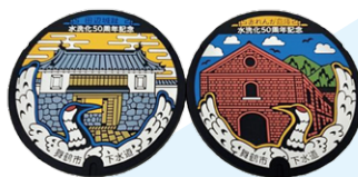
ゴム製マンホールコースター