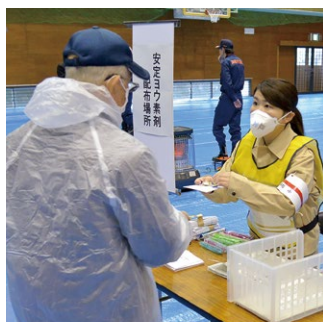
▲安定ヨウ素剤の模擬配布

市では、毎年地域を変えながら住民避難訓練を実施。今回は、PAZ（原子力施設から概ね半径5キロ圏内）の松尾・杉山、UPZN（PAZの外側概ね半径30キロ圏内）の三浜・小橋と泉源寺・田中の自治会を対象に高浜・大飯両原発の事故を想定。松尾・杉山からはバス、三浜・小橋では府道の通行止めを想定し、海上保安庁巡視艇と海上自衛隊へのりによる訓練を実施しました。泉