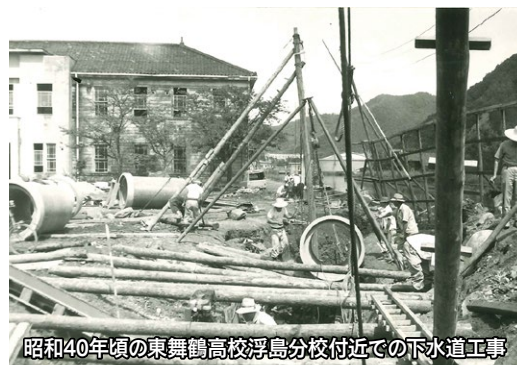
昭和40年頃の東舞鶴高校浮島分校付近での下水道工事