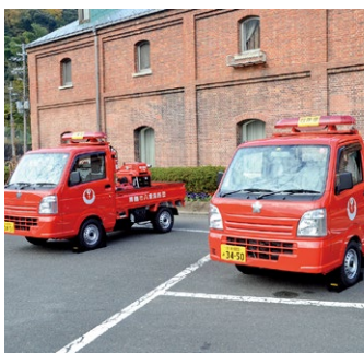
▲配置された赤トラ2台

11月27日に赤れんが2号棟で小型動力ポンプ搬送車(赤トラ)の配置式を行い、四所消防団と八雲消防団に新配置しました。